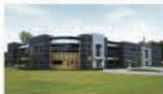
アメリカ開発センター (アメリカ)