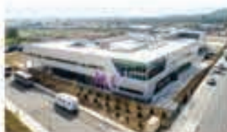
タイロッド開発センター (タイロッド)