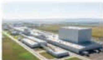
タイロッド工場 (タイロッド)